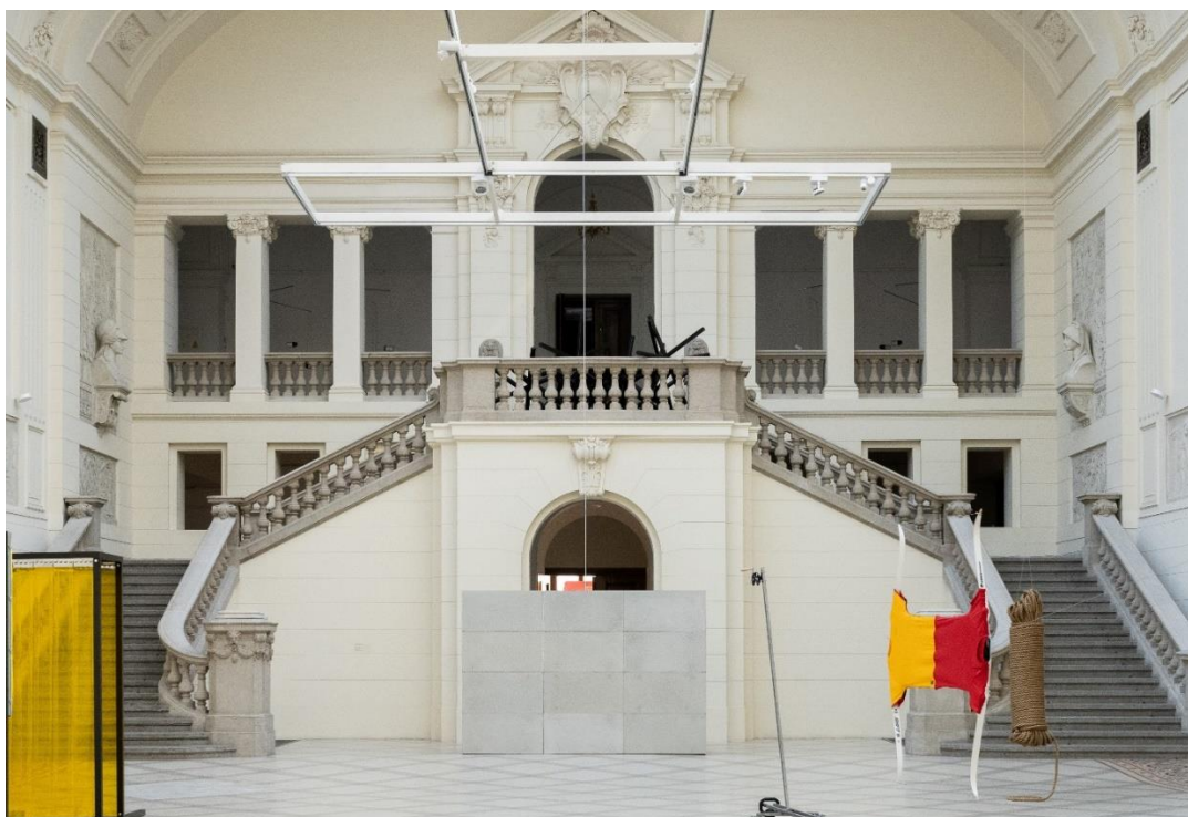
Schody prowadzące do 1 piętro ujęte od strony holu