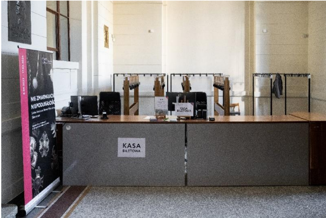
Kasa i szatnia

Wewnątrz należy pokonać 8 stopni, by dostać się na poziom wysokiego parteru. Historyczny gmach Muzeum nie posiada wind. Zwiedzanie ekspozycji wymaga poruszania się po schodach.