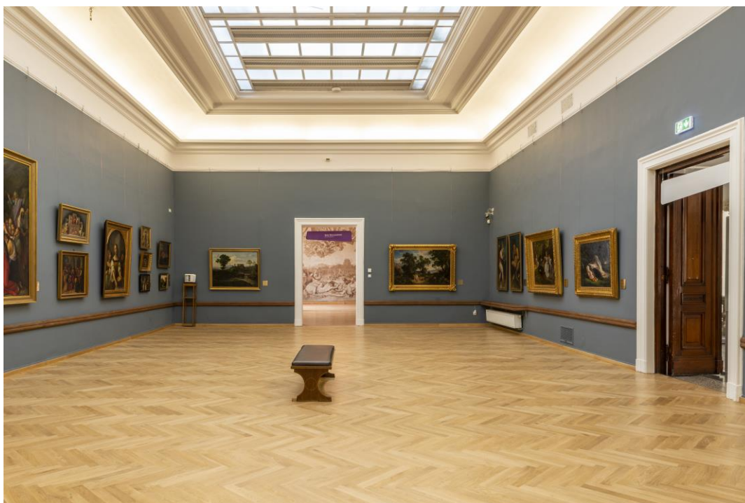
Sala z malarstwem niemieckim, drzwi po prawej prowadzą do schodów na parter do historycznego holu