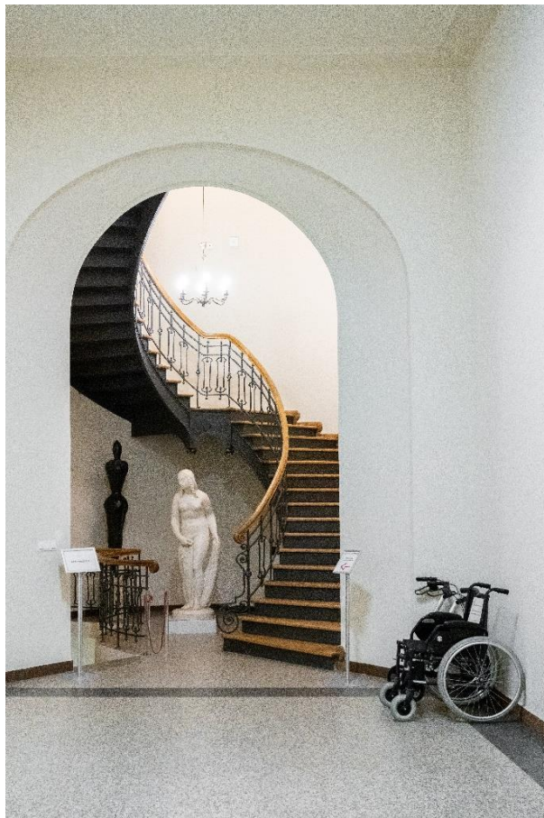
Kręte schody prowadzące na 1 piętro