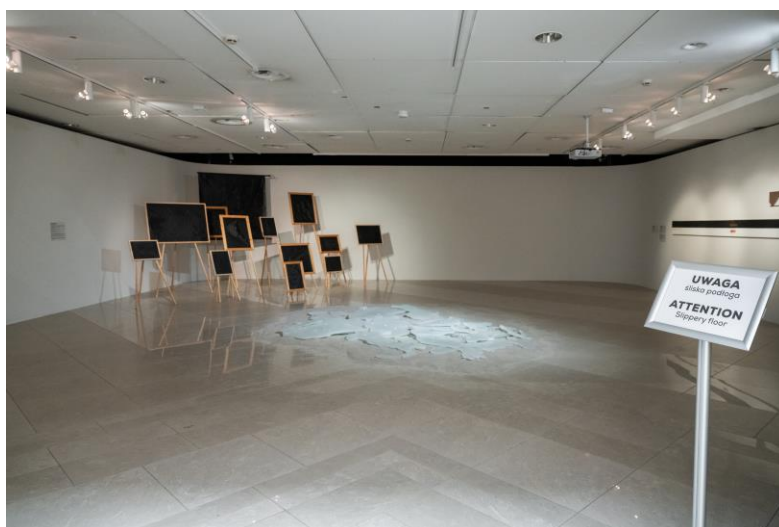
Sala przy patio. Po prawej stronie tabliczka informująca o śliskiej podłodze.