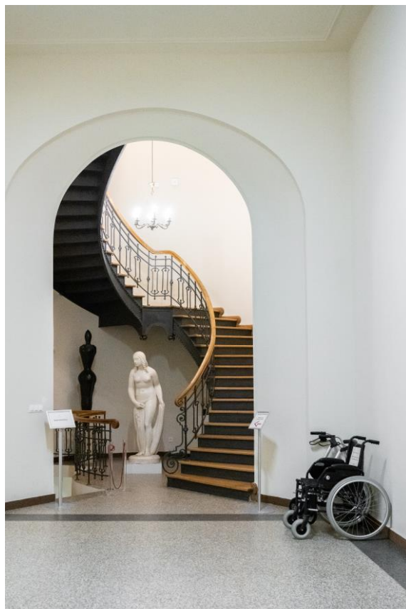
Górny parter korytarza w widoku na kręte schody. Po prawej stronie widać chodzik i wózek. W tym miejscu można odstawić swój wózek dziecięcy.

W Muzeum może panować hałas związany z trwającym remontem.