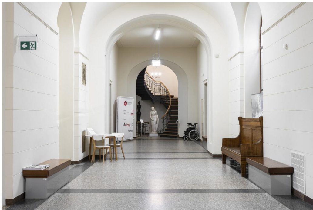
Rysunek 1 Górny parter korytarza - widok na ławki i stół.