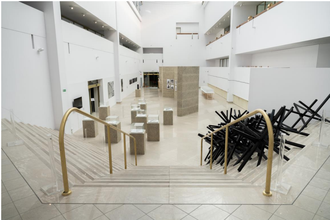
Widok z górnej części patio na schody i na dolną część patio