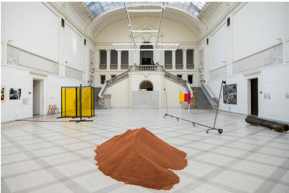
Historyczny hol – początek wystawy czasowej

Po wejściu na wysoki parter kierujemy się prosto na historyczny hol.