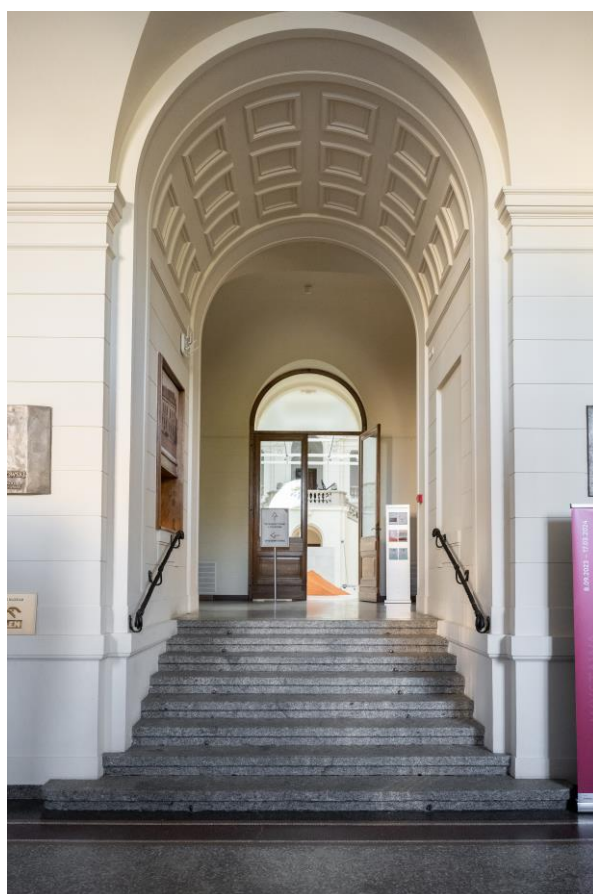
Widok na górny parter, do którego prowadzi 8 stopni

Zwiedzanie ekspozycji wymaga poruszania się po schodach.