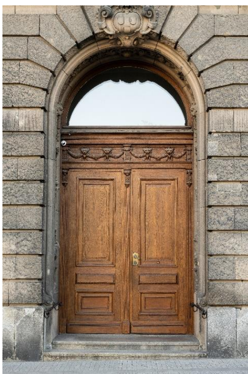
Wejście do historycznego gmachu

Drzwi wejściowe oraz kolejne drzwi wahadłowe są ciężkie. Wewnątrz po prawej stronie znajduje się kasa i szatnia, a po lewej stronie sklep muzealny. W kasie można kupić bilet na wystawę czasową i/lub wystawę stałą.